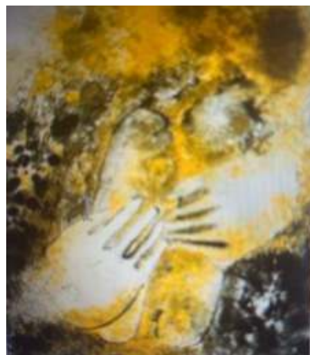
Handen als beeld van Gods dynamische handelen in een proces van heel making