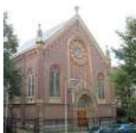
Doopsgezinde kerk Paleisstraat 8 Den Haag

Na afloop is er gelegenheid voor napraten met een drankje