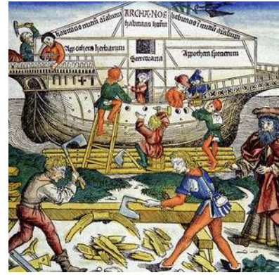
Bouw van Noachs ark

Een pakkende beschrijving volgt: ...de god Azu scheurde de lucht met zijn klauwen..... en de vloed kwam, de een kon de ander niet zien in deze