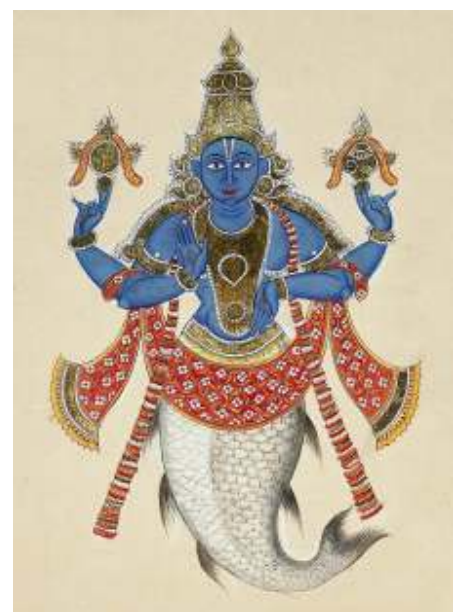
Matsya: Verschijningsvorm van Vishnu als vis