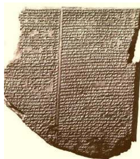
kleitabelt van het vloedverhaal Pergamon museum Berlijn