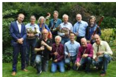
Blazersensemble Voor de Wind

Toegang € 8,00. Leden en vrienden van de Hoeksteen € 6,00 (incl. drankje).