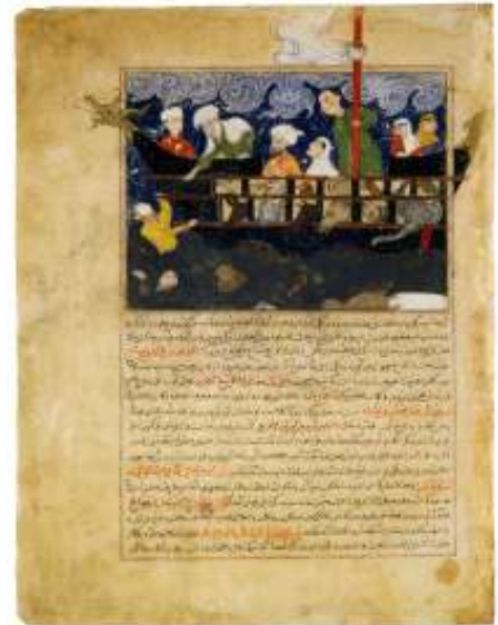
Perzische afbeelding van de ark - Hafiz Abri