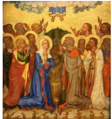
Hemelvaart van Jezus- Meester van Vissy, ca 1350

Mozes stierf op de berg Nebo en God begroef hem volgens Deuteronomium . In Judas 9 worden hierover de apocriefe boeken Henoeh en Hemelvaart van Mozes geciteerd, waarin de aartsengel