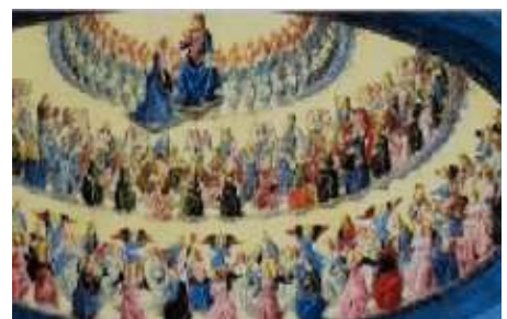
Maria, na haar hemelvaart al in de hemel - Francisco Botticini - 1475