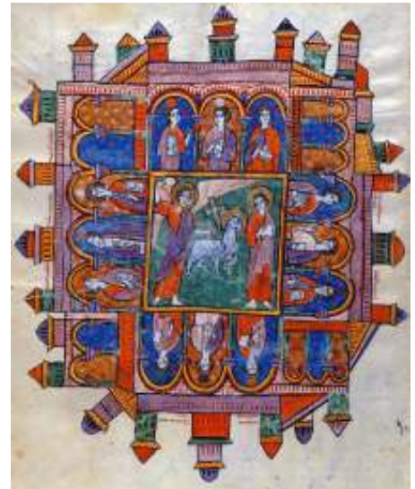
Het 'hemelse Jeruzalem', middeleeuwse afbeelding

Maar ondanks die afwijzing vormen toekomstvoorspellingen juist het hart van het joden- en christendom. Het gaat daarbij om de lange termijn voorspellingen over een toekomstige 'heilsstaat', de komst van de messias en/of de wederkomst van Christus. Misschien noemt men die liever geen toekomstvoorspelling maar 'toekomstige feiten'? Het zijn in elk geval toekomstvisies die je kunt koppelen aan bijbelboeken zoals Daniël, Jesaja en Openbaring. Deze 'voorspellingen' spelen vooral op de achtergrond van het joden- en christendom een rol maar worden in tijden van crises, zoals de coronapandemie, met hernieuwde belangstelling gelezen. Aan de toekomstige nieuwe wereld of heilsstaat gaan namelijk volgens de beschrijvingen vaak rampen en gruwelijkheden vooraf. Luidt corona die nieuwe tijd in?