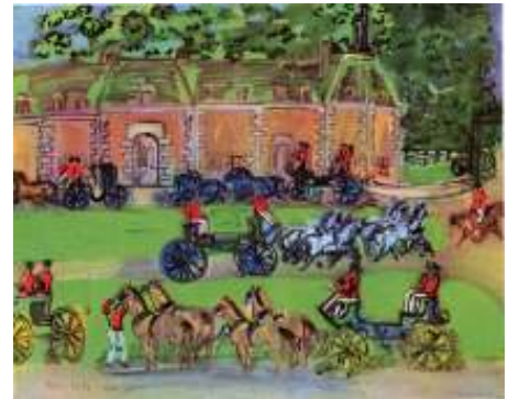
R. Dufy, Kasteel en paarden (1930)

Als een zwart en onbepaald gesternte draaien ze hun blauwe hemel rond, hoger, hoger, tot zij in de verte los geraken van de moedergrond.