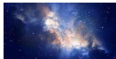
De sterren uit Openbaringen 12