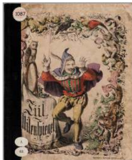
afb.5 Tijl uil