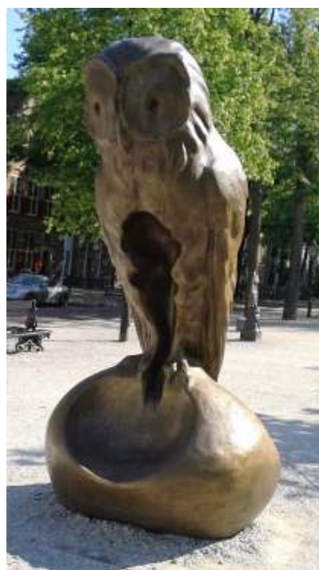
afb. 6 Vivisecteur uil