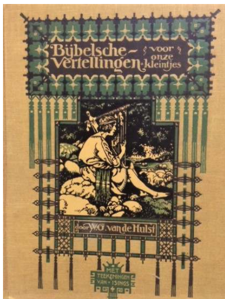
Kinderbijbel ca 1936 met illustratie van Isings