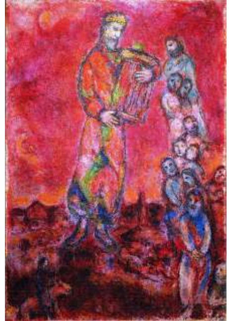
Marc Chagall, David en de psalmen

De uitdrukking staat in Jeremia 19: 8: “Ik zal deze stad maken tot een voorwerp van ontzetting en tot een aanfluiting. Ieder die erlangs gaat, zal zich ontzetten en fluiten om al haar slagen”. Blijkbaar floot men vroeger afkeurend of van verbijstering bij het zien van iets schokkends, misschien op de vingers. Wij kennen in onze tijd ook nog het fluitje van verbazing, het fluitje van bewondering en andere. Maar het gefluit wordt in de moderne vertaling helemaal weggelaten.