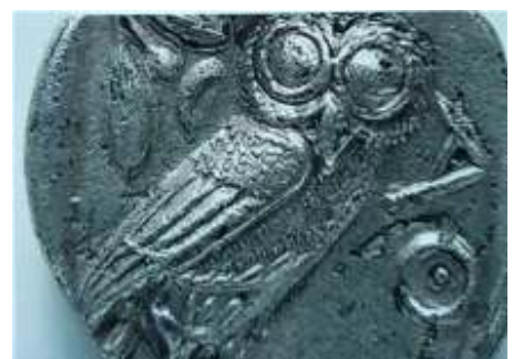
afb.3 as uil