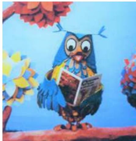
afb.7 mijnheer de uil