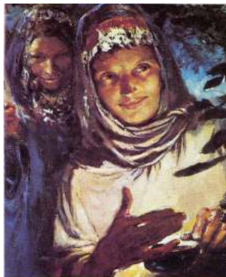
illustratie uit: Hamlyn Bible. Vrouwen met brandend olielampje

En tot slot Miriam (Exodus 2). Miriam helpt haar moeder en broertje Mozes. Zij is het die zorgt dat Mozes bij de Farao terechtkomt. Ze is ook trouw als oudere zus. Een familiemens die zich in veranderende