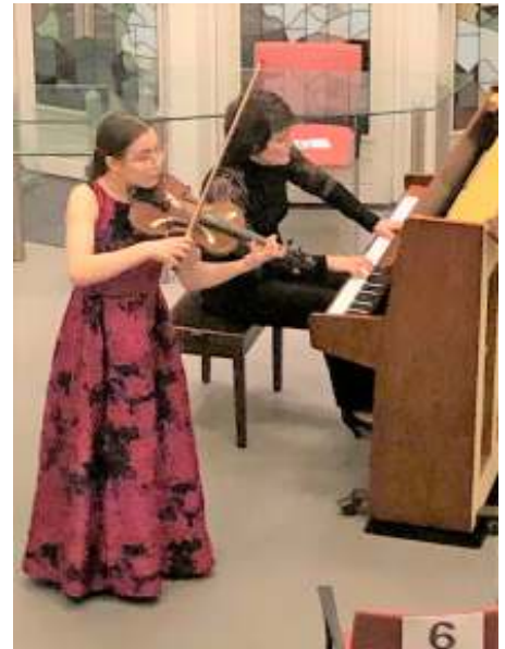
Jong talent 14 jaar

In de coronatijd gaat het vooral om kerkdiensten, Hoeksteenlezingen en bijvoorbeeld een concert van een paar musici op 1,5 meter afstand.