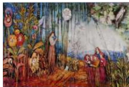
'Koor in geheimzinnig bos', Aimee Birnbaum.

Er naast staat, nog poëtischer verwoord: "Het geheim van het nieuw maken van een lied is afhankelijk van het feit of we weten hoe een goede geliefde te zijn. Ik vergeet alles wat ik al ken van mijn geliefde en benader hem/haar als een volstrekt nieuw wonder. Ik laat mijzelf