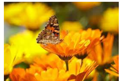
Liefde voor de schepping