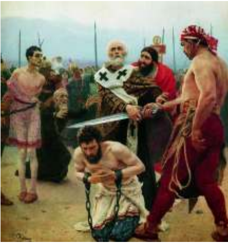
Ilja Repin – Sint Nicolaas redt drie onschuldigen

Nicolaas rent naar de executieplaats en komt net op tijd om het zwaard waarmee de onschuldige burgers onthoofd zullen worden uit handen van de beul te grissen. Hij maakt de boeien van de veroordeelden los en zegt dat hijzelf wel in de plaats van deze onschuldigen wil sterven. Vervolgens ijlt hij naar de woning van de commissaris en dreigt dat hij diens corrupte gedragingen zal doorgeven aan de keizer via de drie veldheren die toevallig aanwezig zijn. De commissaris geeft toe en geeft de drie gevangenen de vrijheid. Het manuscript gaat nog verder en verhaalt dat de veldheren na hun terugkeer aan het hof middels allerlei valse beschuldigingen door de ambtenarenklik worden gearresteerd en in de gevangenis belanden.