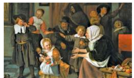
Sinterklaasfeest - Jan Steen