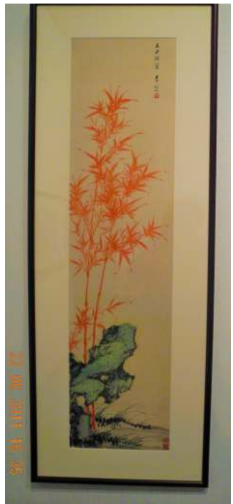
Bamboo in red, Li Yanshan, inkt en verf op papier, Hong Kong Museum of Art, 2011