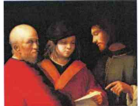
De drie levensfasen van de mens: Giorgio da Castelfranco (1478-1510)

Moet de yep niet alvast eens nadenken over later? Plannen maken? Of bijvoorbeeld op advies van de opruimgoeroe Marie Kondo aan de slag? Het is erg moeilijk anderen daarover te adviseren. Niemand weet immers wat de toekomst brengen zal. Wat ik wel bijna zeker weet, is dat ook de leeftijd van de yeps steeds meer op zal schuiven. Van zestiger naar zeventiger, naar tachtiger, naar negentiger. Niemand wordt graag als ‘ouder’ bestempeld. Een ‘young elderly person’ genoemd te worden als honderdjarige is dan wel weer aantrekkelijk. Maar ondanks dat verandert de tijd ons, gebeurt er wat in ons. Worden we bedachtzamer, zachtaardiger of zelfs wijzer? Een dichter zegt: