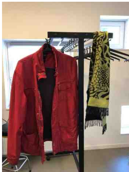
Kleding die is blijven hangen

Tenslotte nog dit: er is in de laatste periode kleding in het gebouw achtergebleven. Zie hiervoor de