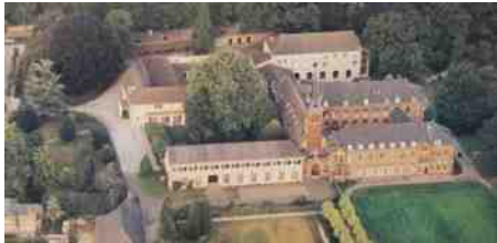
Onze Lieve Vrouwe Abdij te Oosterhout