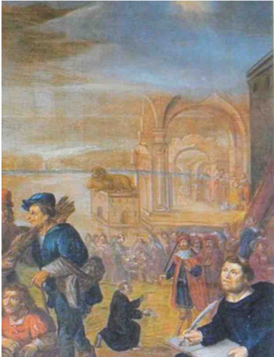
afb. 1 De droom van de keurvorst Frederik III (detail)