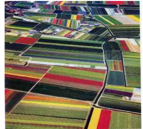
Karel Tomeï - De bovenkant van Nederland

Dat roept wel de vraag op of het misschien van betekenis is die verschillen te handhaven? Is de taal, je moedertaal, niet verbonden met je diepste gevoelens of zelfs je ziel? In dat geval zou het verliezen van het Nederlands in het hoger onderwijs een zeer ingrijpend verlies zijn, veel meer dan smaak en voorkeur, verbonden met zielskracht en creativiteit. Moeten wij niet eens voor onze taal opkomen?