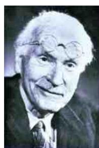
Carl Gustav Jung