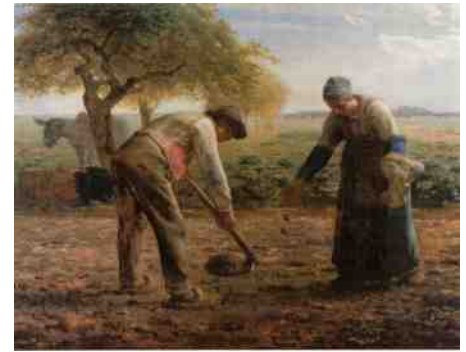
De aardappelplanters J.F. Millet (1861)

b) De ethische opdracht van de Bijbel als uitgangspunt nemen: Als centraal ethische opdracht kun je 'zorgdragen voor anderen en opkomen voor zwakkeren in de samenleving' nemen. Deze houding zou je zonder veel problemen kunnen uitbreiden om ook de natuur, dieren en planten te omvatten.