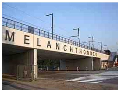
metroviaduct Melanchthonweg Schiebroek, 2006

vereeuwigd op een Rotterdams metroviaduct (E-lijn), dat kruisend verkeer overbrugt met mogelijkheid van uitwisseling.