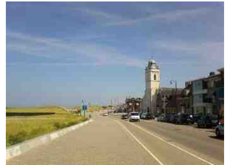
Katwijk, het witte kerkje

Voor de mensen die op zondagen naar de kerk gaan blijkt ook het beleven van rust en stilte een steeds belangrijkere reden om te gaan. In de kerk is er ruimte voor een heel ander levensritme. Echt stil is het er natuurlijk niet maar je kunt in jezelf de stilte vinden van 'niets te hoeven' en tijd voor jezelf. Op adem komen en ervaren dat er meer is