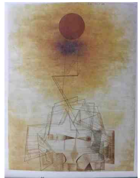
Grenzen aan het verstand, Paul Klee, 1927