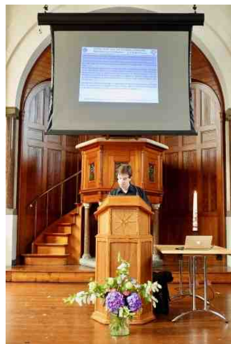
Lezing over de geschiedenis.