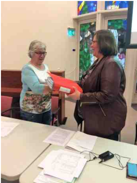
Overdracht financiële stukken