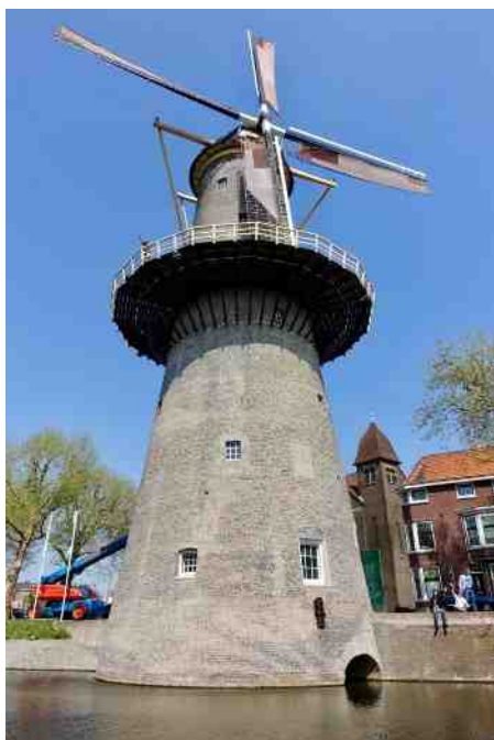
Museummolen t.o. de Kerk