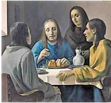
Afb 2. Han van Meegeren – De Emmaüsgangers (1937, Museum BvB, Rotterdam)