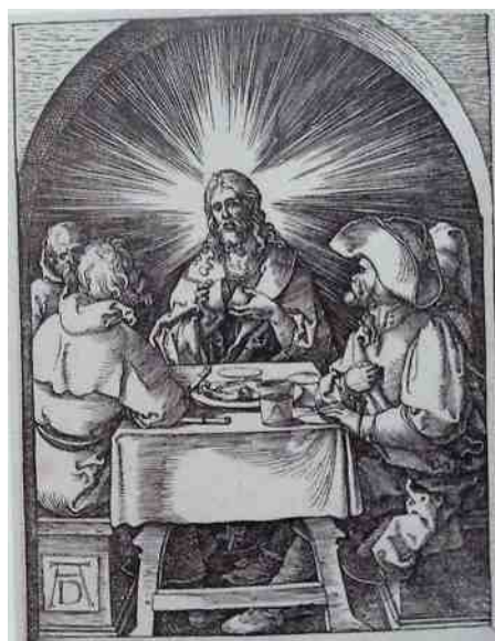
afb 1. Albrecht Dürer – De maaltijd te Emmaüs (houtsneede ca. 1510, RM Amsterdam)