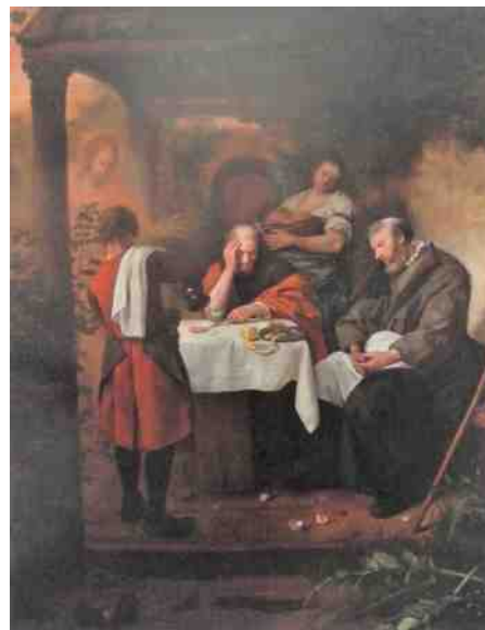
afb 3. Jan Steen - De maaltijd te Emmaüs (ca 1666, RM Amsterdam)

beeldt Christus echter niet uit als centrale figuur aan een tafel, maar zijn verdwijning die volgde op de herkenning. Alleen zijn schim is door de struiken nog vaag zichtbaar. De discipelen blijven verweesd achter ( afb. 3 ).