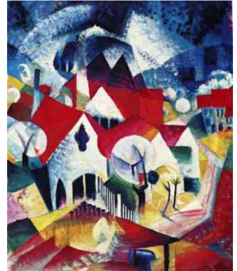
Johannes Itten: Groepje huizen in de lente (1916)