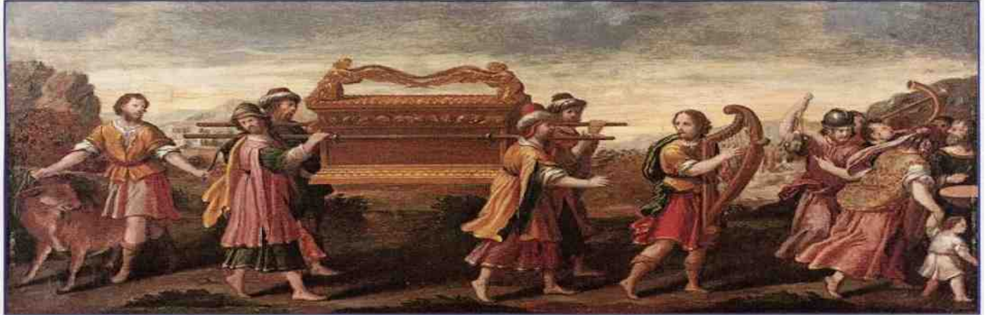
Koning David en de Ark, schilder onbekend.