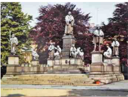
afb.3 herdenkingsmonument Rijksdag te Worms (banvloek Luther)

wijde heroriëntatie van de mens in de wereld om hem heen. Luther zelf moest dat met de rijksban bekopen (afb. 3).