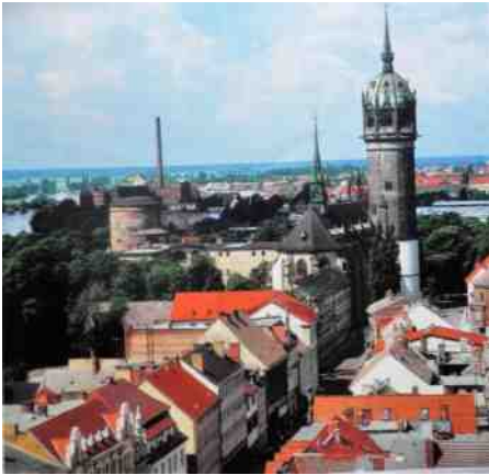
afb. 1 de slotkerk te Wittenberg

Toen u vanochtend de post met dit blad erin opraapte, heeft u vast de gangvloer nog voelen natrillen van de hamerslagen waarmee, nu precies 500 jaar geleden, Maarten Luther zijn 95 stellingen op de deur van de slotkerk te Wittenberg timmerde (afb.1, 2). Dat leidde uiteindelijk tot een wereld-