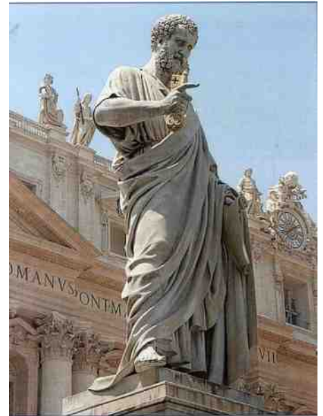
St. Petrus bij St. Pieter in Rome

Een bekende naamsverandering komen we tegen in Johannes 1:42 waarbij Jezus zijn discipel Simon de nieuwe naam Kefas geeft. De betekenis van het Hebreeuwse Kefas en het Griekse 'Petros' is rots of steen. Petrus wiens volle naam Simon Bar-Jona (zoon van een duif) is, gaat daarmee een krachtigere naam dragen; nu verbonden met een rots in plaats van een duif. (Al kan ik hier uiteraard niet uitsluiten dat Jezus Christus met de naamswijziging (nog) een heel andere bedoeling had.) Jezus zou bovendien gezegd hebben: "Op die rots zal ik mijn gemeente bouwen" (Matteüs 16: 18). Vervolgens worden echter de oude en nieuwe naam geregeld samen gebruikt: Simon Petrus.