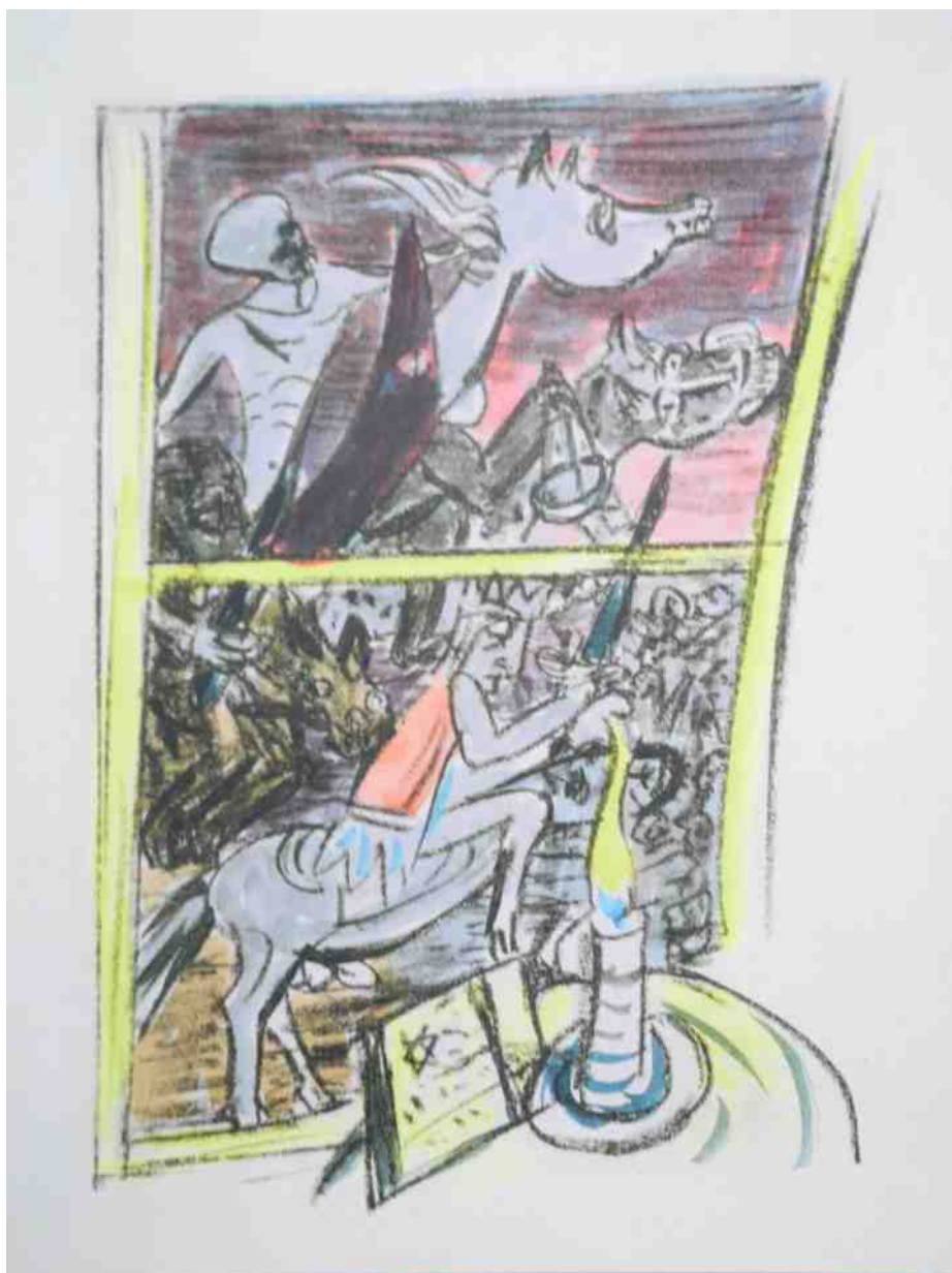
afb. 3 De vier Apocalyptische Ruiters

pen'. Zijn 27 litho's bij de Apocalyps ademen dezelfde geest.