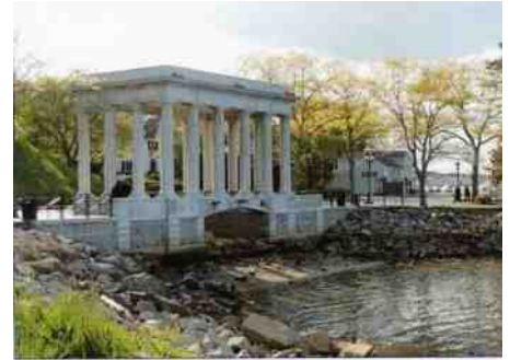
Herdenkingsplaats van de Pilgrims in Plymouth

In 1620 vertrok rond een derde van de Pilgrim Fathers uit Leiden. Vooral sterke, jonge mensen, 73 mannen en 29 vrouwen onder leiding van William Brewster, een ouderling van hun gemeenschap. Via Delftshaven gingen ze en vanaf Southampton met de Mayflower op weg naar Noord-Virginia waar ze een patent op grond hadden verkregen. Door diverse (weers)omstandigheden kwam hun nieuwe kolonie bij Plymouth in Massachusetts te liggen. Nog steeds wordt hun landing op Plymouth Rock herdacht.