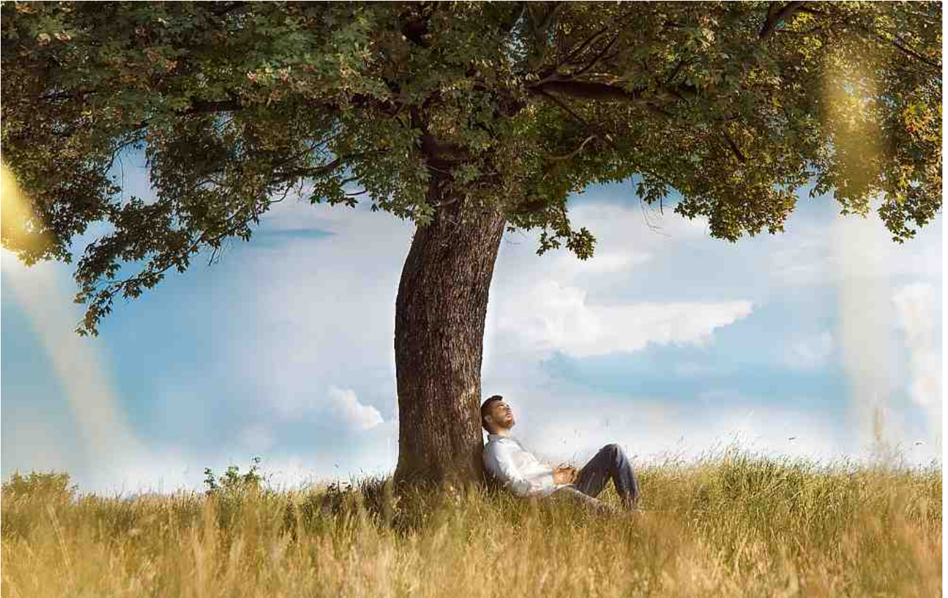
thuiskomen - bij jezelf