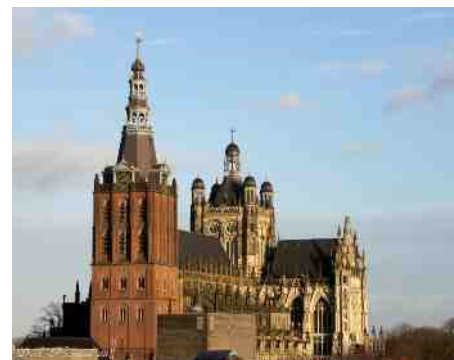
St. Jans Kathedraal Den Bosch