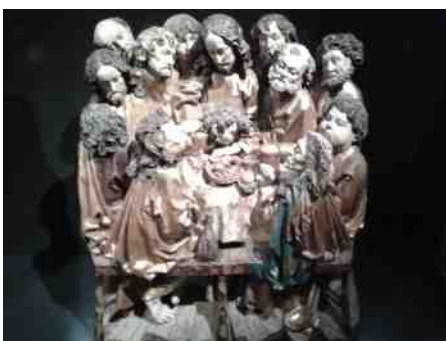
Houten beeld voorstellende het Avondmaal - Rijksmuseum